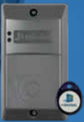
Lecteur de badges BR

Éliminez totalement les fausses alarmes et optez pour un système accessible, portable et qui peut s'installer partout !